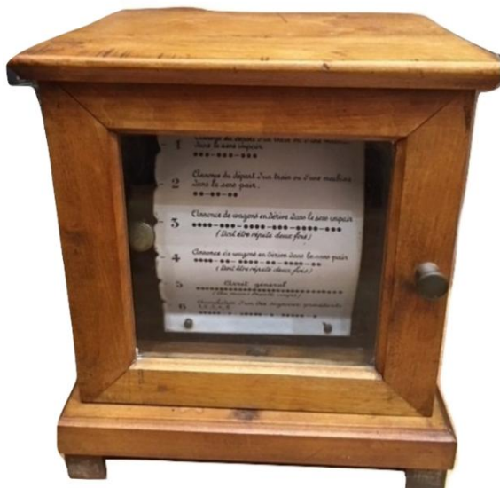
Transmetteur automatique Breguet

Ces modèles sont des télégraphes pour transmissions automatiques de signaux fabriqués par la maison Breguet (1898) utilisés sur la voie ferrée française de la compagnie PLM (Paris - Lyon - Méditerranée).