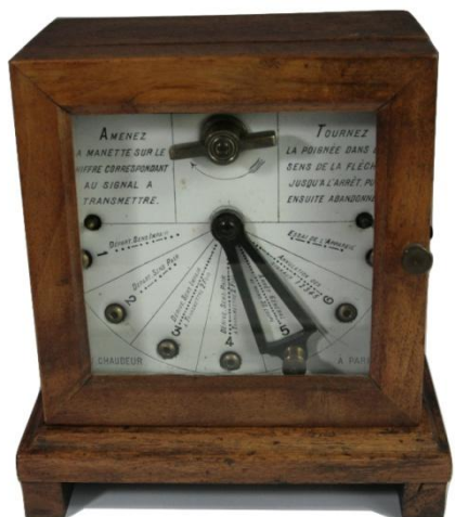
Transmetteur automatique Chauder