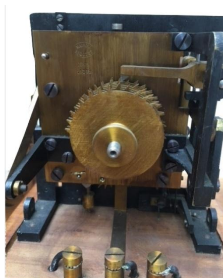
Mécanisme du transmetteur Breguet