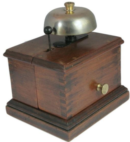
Sonnette pour l'exploitation des signaux à cloche