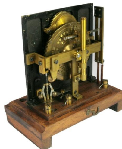
Mécanisme du transmetteur Chauder